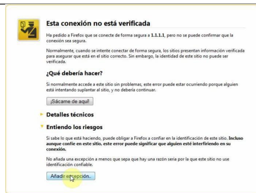
Fig.2 - Firefox