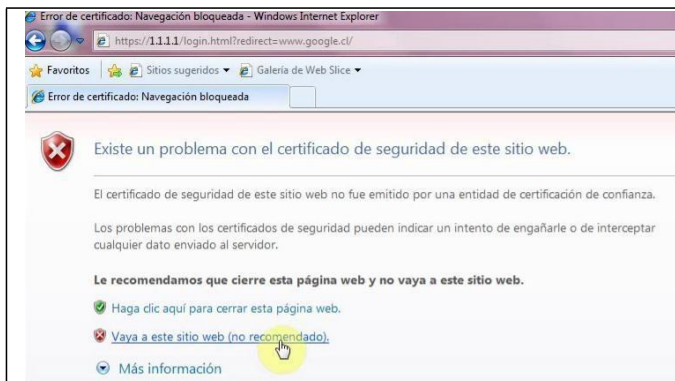
Fig.1 - Explorer

Una vez asociado a la señal inalámbrica (SSID), se procede a abrir el navegador web que deseemos. A continuación, debemos autorizar a nuestro navegador para acceder al portal UV, ventana que se ve reflejada de la siguiente forma en los siguientes 3 tipos de navegadores: