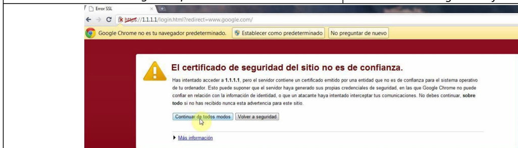
Fig.3 - Chrome